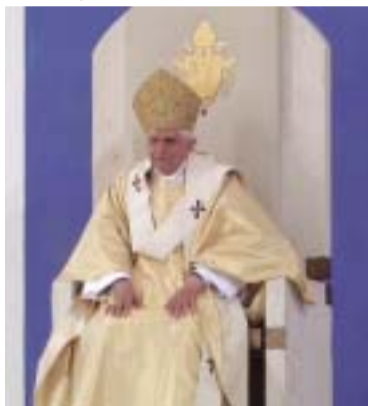
unten: Der Papst mit Mitra auf dem Thron - wie ein heidnischer Götterpriester

ist, verdunkelten die Priester diese urchristliche Wahrheit. Sie schwangen sich selbst zu Götterpriestern auf, die den Menschen vorgaukeln, den Zugang zu Gott vermitteln zu können. In Wahrheit haben sie keinen Bezug zum Ewigen. Mit dem Einen, der im Urgrund der Seele jedes Menschen wohnt, haben sie nichts gemeinsam. Sie huldigten über Jahrtausende heidnischen Kulturen wie dem Baalkult und übertrugen ihre heidnischen Rituale und Zeremonien kurzerhand auf das Christentum, das von da an nur noch dem Namen nach eines war. Sie setzten sich selbst zu Göttern dieser Welt ein, die bis heute in Roben und goldbestickten Gew