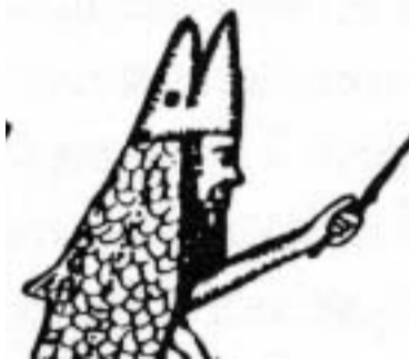
oben: Der heidnische Fischgott Janus oder Dagon mit Mitra

Ganz einfach: Die seit Jahrtausenden herrschende Priesterkaste vereinnahmte das gerade im Aufbau befindliche Urchristentum und drehte es um. Während Jesus lehrte, dass der Geist Gottes inwendig in jedem Menschen wohnt, dass also jeder Mensch ein Tempel Gottes